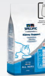
FKD 1 a 3 kg

FKD/FKW Kidney Support = diéta vo forme granúl aj konzervy so zníženým obsahom bielkovín, sodíka a medi (zaručí nižší obsah dusíkatých látok, zníži zadržiavanie tekutín a nízka hladina medi napomáha správnej funkcii pečene). Zvýšený obsah EPA a DHA (omega 3 nenasýtené mastné kyseliny).