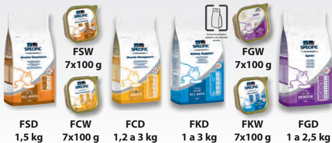
FSD 1,5 kg FCW 7x100 g FCD 1,2 a 3 kg FKD 1 a 3 kg FKW 7x100 g FGD 1 a 2,5 kg

FGD/FGW Senior – granuly a konzerva pre staršie mačky na prevenciu vzniku kalcium-oxalátových kryštálov (znížený obsah bielkovín a sodíka, tvorba moču s pH okolo 6,6).