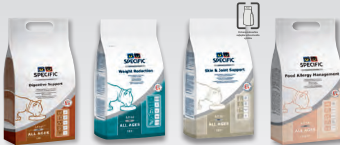
FID 1 a 2,5 kg

FQD Omega Plus Support – diéta vo forme granúl s vysokým obsahom omega 3 (z rýb) a omega 6 (z boráka lekárskeho) nenasýtených mastných kyselín v ideálnom pomere (1:1).