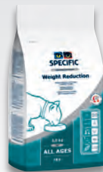
FRD 0,9 kg a 2 kg

Poznámka: Energetická hodnota a ďalšie parametre sú uvedené v tabuľke na konci letáku.