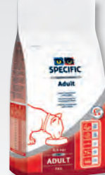
FXD 0,9; 2 a 7,5 kg