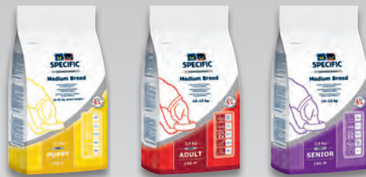
CPD – M 2,5 kg a 7,5 kg

Konzerva CGW Senior All Breeds – pro starší psy středních plemen nad 7 let věku.