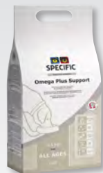
CQD 3,5 kg a 7,5 kg