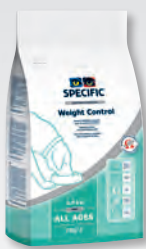
CRD - 2 2 kg a 13 kg