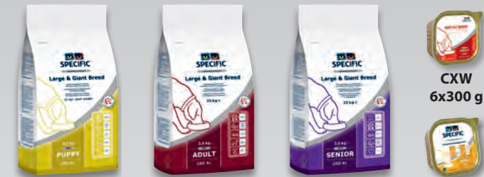
CPD – XL 2,5 kg a 14 kg

Konzerva CGW Senior All Breeds – pro starší psy velkých plemen nad 6 let věku a gigantických plemen nad 5 let věku.