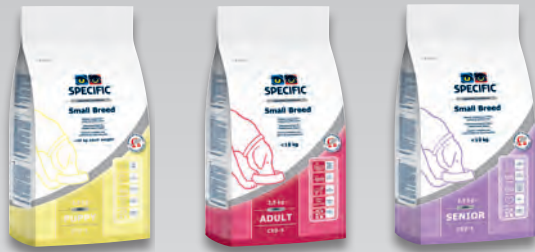
CPD – S 1 kg a 2,5 kg

Konzerva CGW Senior All Breeds – pro starší psy malých plemen nad 8 let věku.