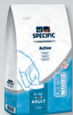
CAD 12 kg

CT-H Healthy Treats (pamlsk ve tvaru kostiček) – pamlsky mají nízký obsah tuku a zvýšený podíl vlákniny. Jsou vhodné jak pro zdravé psy, tak pro psy se sklonem k nadváze. Díky jejich složení je možné použití i u psů s cukrovkou nebo chronickým onemocněním ledvin.