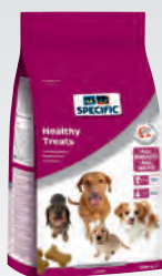
CT-H 300 g