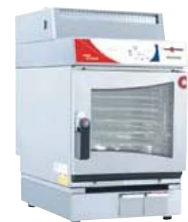
OES 6.10 mini easyToUCH se systémem CONVOClean, CONVOVent