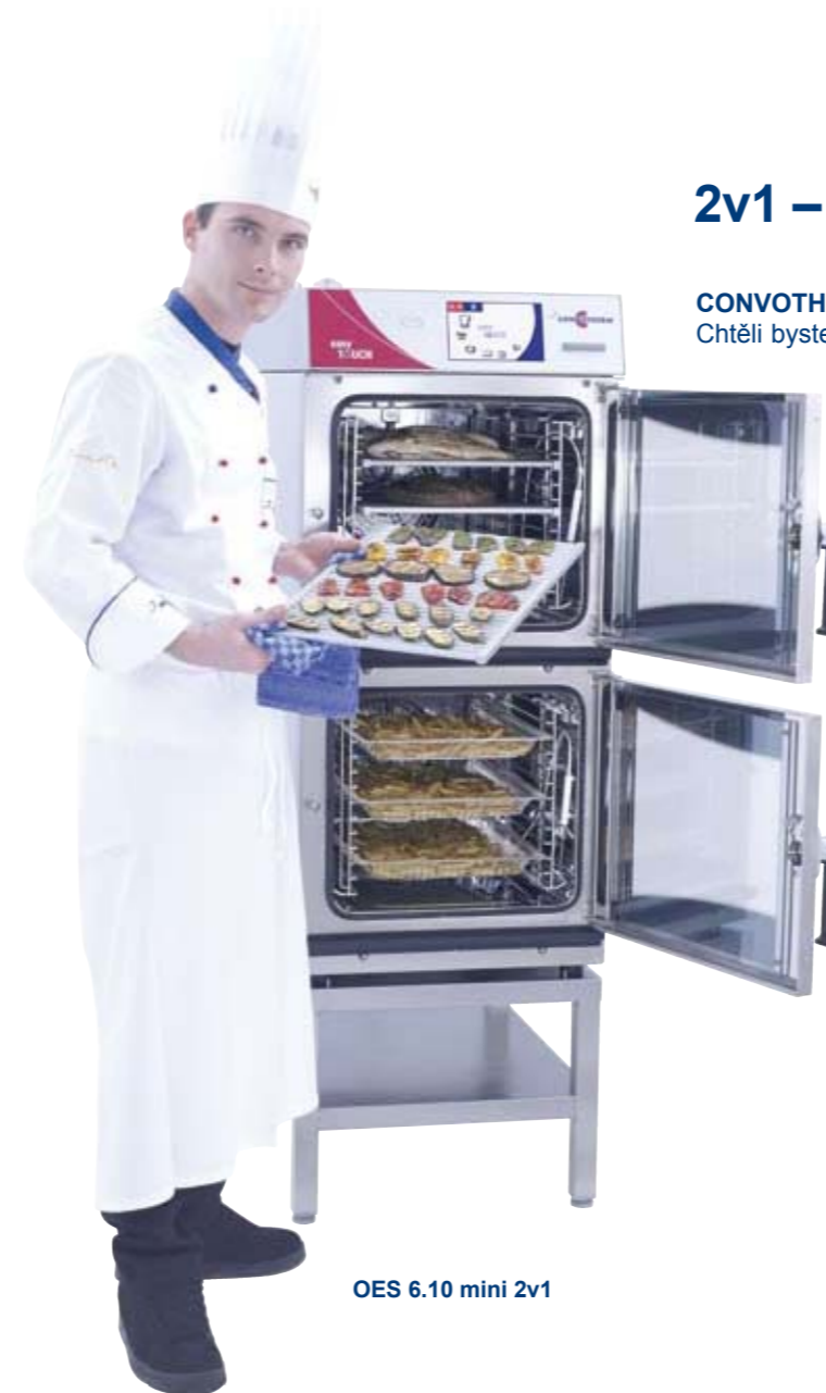
OES 6.10 mini 2v1