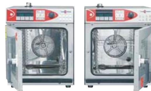
2 x OES 6.06 mini s levým a pravým zavíráním

... také dokonalé příslušenství splňující Vaše požadavky: