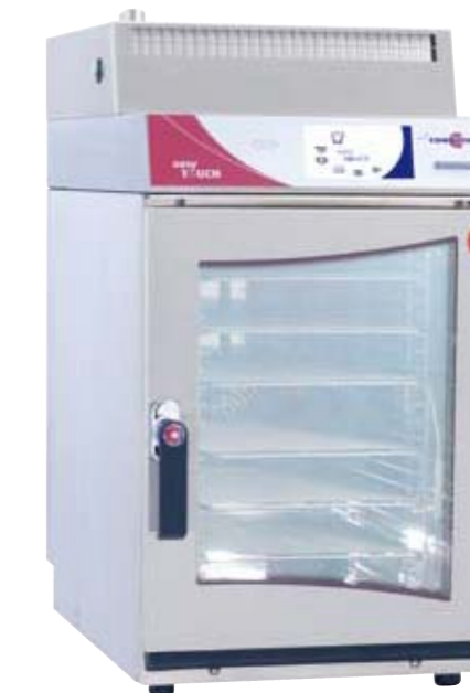
OES 10.10 mini s funkcí CONVOVent

S kondenzačním nástavcem CONVOVent se tento mini model ideálně hodí k vaření před hosty. Kondenzační nástavec odvádí téměř všechny výpary z vaření a je zárukou čerstvého vzduchu v místnosti. Snadné a uživatelsky přátelské ovládání je samozřejmostí, další vodovodní přípojka není nutná.